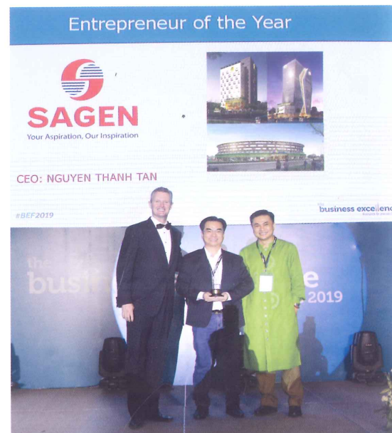
Sagen nhận giải thưởng “Entrepreneur of the Year”