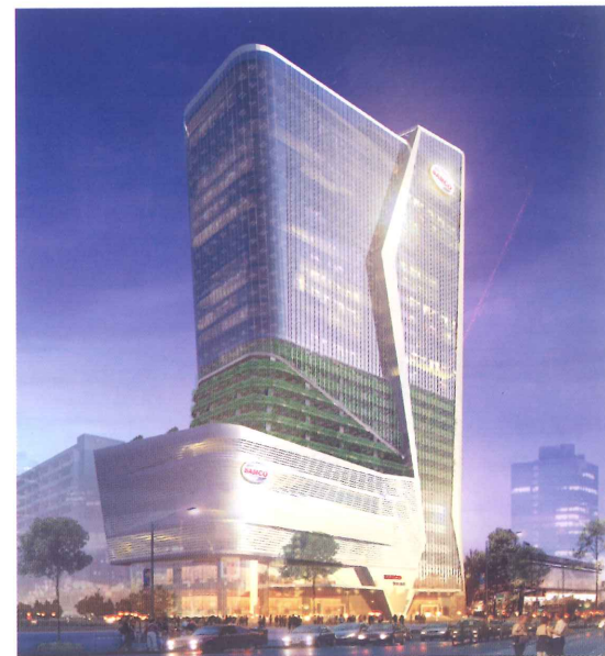
Cao ốc văn phòng kết hợp TMDV Ô Tô Samco Cô Giang Địa điểm XD: 121-139 Cô Giang, Quận 1, TP.HCM DT sàn xây dựng: 45.000 m 2