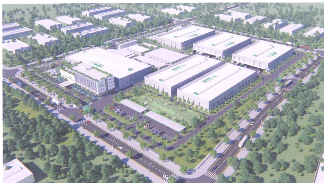
Nhà máy dược phẩm DANAPHA theo tiêu chuẩn GMP-WHO, EU, FDA Địa điểm XD: Khu Công Nghệ Cao, Đà Nẵng DT khu đất: 79.000 m 2